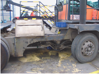
ITV ÇEKİCİ ARAÇ KAPORTA, YAKIT DEPOSU, YAĞ DEPOSU, AKSESUAR DÜZELTME, DEĞİŞİM VE YENİLEME İŞLERİ.