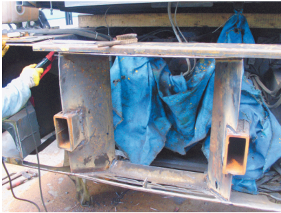
HASARLI PARÇALARIN YENİDEN İMAL EDİLEREK DEĞİŞİMİ.