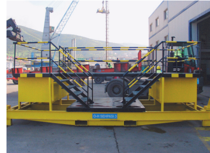
LİMAN GENELİ YARDIMCI EKİPMAN, KAPASİTE ARTIRIM PROJE GELİŞTİRME VE İMALATLARI